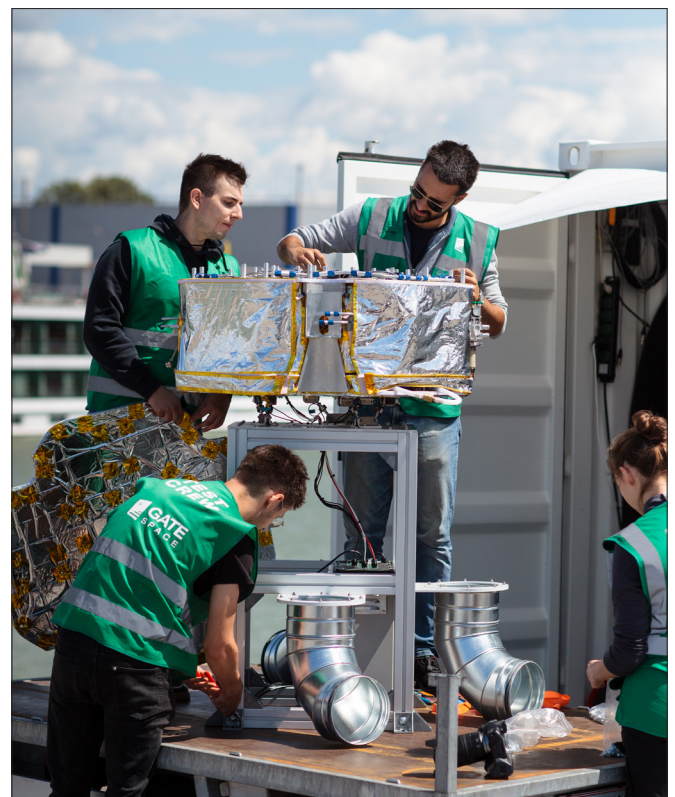
Das Test-Team von GATE Space bei der Arbeit